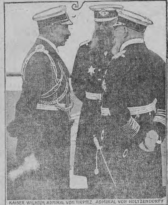
El Kaiser se ve en este grabado con dos de sus principales Almirantes, Von Tirpitz y Von Holtzendorff. Esta instantánea fue tomada recientemente, cuando estos tres personajes discutían las operaciones navales en caso de una guerra con Inglaterra, y es indudable que haya habido otras conversaciones semejantes después del primero de agosto en curso.